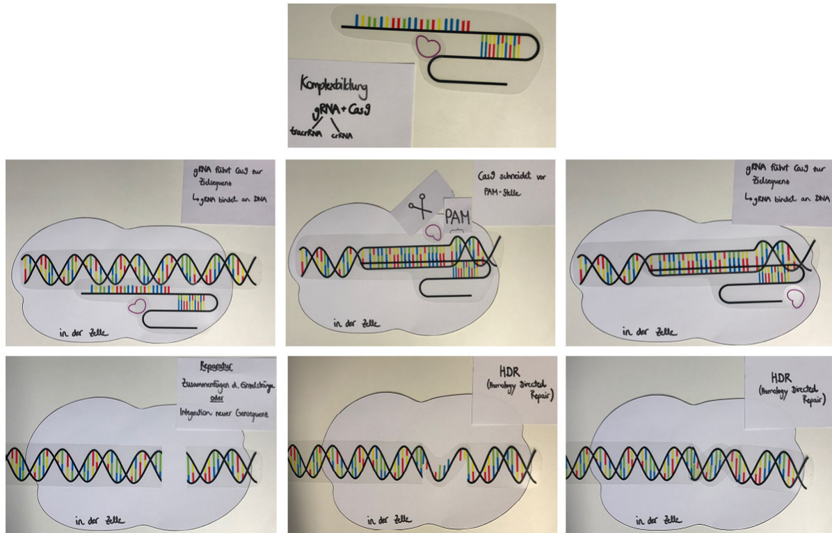
Abbildung 3: Screenshots eines beispielhaften Erklär-Videos, das im Rahmen der Erprobung entstanden ist.