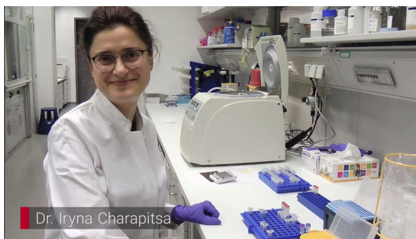
Abbildung 2: Ausschnitt aus dem Film "CRISPR/Cas9 im Genlabor".