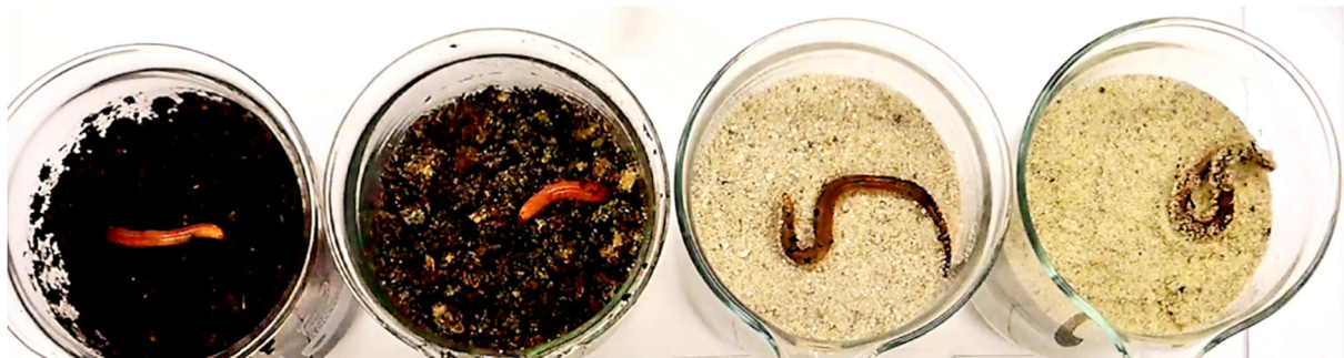
Abb. 10: Aufnahme während des Versuchs: Die Regenwürmer in Versuchsansatz 1 (Erde) und 2 (Erde mit feinem Sand gemischt) sind beide fast vollständig im Boden vergraben, der Regenwurm in Ansatz 3 (grober und feuchter Sand) liegt dem Sand auf und kann sich nicht vergraben, der Regenwurm aus Ansatz 4 (feiner und trockener Sand) beginnt damit, Stresssymptome zu zeigen und wird daraufhin dem Versuchsgefäß zu seinem Schutz entnommen.

Die dritte und abschließende Lerneinheit ist in diesem Artikel nicht beschrieben. Sie kann als möglicher Anknüpfungspunkt dienen, die Unterrichtsreihe noch weiter fortzuführen. Die abschließende Lerneinheit, die sich über zwei Doppelstunden erstreckt, gibt den SuS Raum das erlernte Fachwissen anzuwenden und selbstständig Experimente zu planen und durchzuführen. Das Thema der Lerneinheit ist das „Selbstständige, experimentelle Erforschen des Regenwurms“ und baut inhaltlich und methodisch auf den Vorgängerstunden auf. Diese abschließende Lerneinheit stellt den Höhepunkt der didaktischen Steigerung dar. Die SuS sollen selbstständig forschen und die Stufen des Forschungsprozesses durchlaufen.