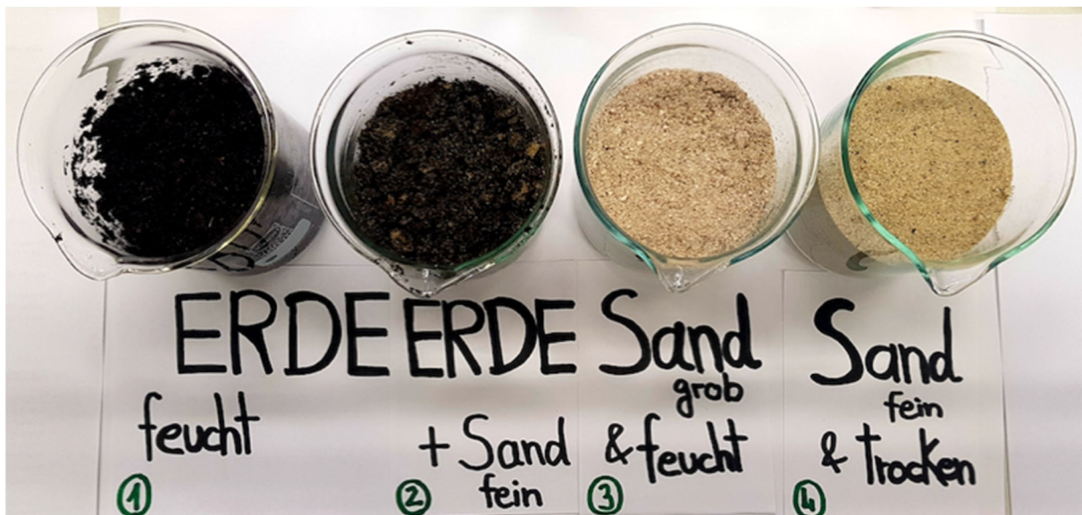
Abbildung 9: Versuchsaufbau. Versuchsansätze mit feuchter Erde (1), Erde mit feinem Sand gemischt (2), grober und feuchter Sand (3), feiner und trockener Sand (4).

Im zweiten Versuchsteil wird die Reaktion der Regenwürmer auf extreme Bodentemperaturen untersucht. Als Versuchsboden wurde die gleiche Anzuchterde wie für die Marsterrarien verwendet. Zunächst müssen in vier 400 ml Bechergläsern vier verschiedene Temperaturbereiche eingestellt werden: gefroren, gekühlt, raumtemperiert und erhitzt. Mit dem Wissen aus dem Info Text und den Beobachtungen kommen die SuS zu dem Schluss, dass Regenwürmer weder extrem hohe noch extrem niedrige Temperaturen tolerieren und daher unter herkömmlichen Bedingungen auf dem Mars nicht überleben können. Um die Regenwürmer nicht unnötig zu stressen, sollten diese nach Auftreten der Stresssymptome aus dem Becherglas entnommen werden.