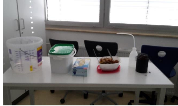
Abbildung 6: Durchführung im Unterricht (Station 1).

Sobald die SuS ihr Marsterrarium fertig gebaut haben dürfen sie zur zweiten Station übergehen (siehe Abb. 6). Dort wird der Boden des Marsterrariums mit Hilfe einer Spritzflasche angefeuchtet und die oberste Schicht mit organischen Abfällen wie Zwiebelschalen, Kaffeesatz, alten Blätter und Rasenschnitt bedeckt. Da sich die Regenwürmer bevorzugt am Boden des Wurmeimers aufhalten ist es empfehlenswert die Würmer samt Erde in einen zweiten Eimer umzuschütten. So liegen die Regenwürmer an der Oberfläche und sind für die SuS leicht zugänglich. Als letztes sollen die Gläser mit je drei Regenwürmern bestückt werden. Durch die originale Begegnung mit dem Regenwurm wird die affektive Ebene miteinbezogen und positiv verstärkender Teil der Lernerfahrung (vgl. Killermann et al. 2018, S. 97). Für Kinder, die sich noch nicht trauen einen Regenwurm mit der Hand anzufassen, werden Handschuhe bereitgestellt.