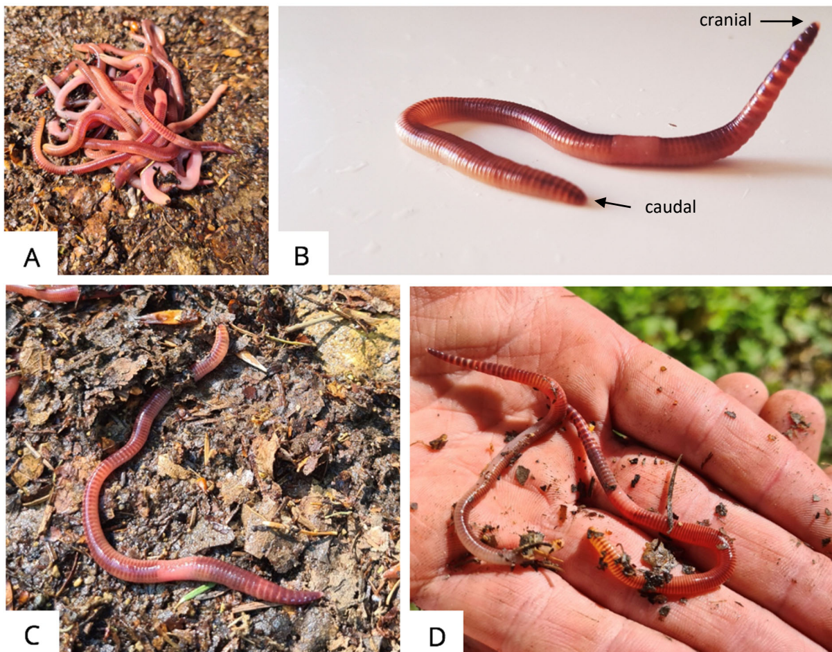
Abbildung 2 A-C: Lebende Exemplare der Regenwurmart Dendrobena veneta : (A) Regenwürmer im Freiland, (B) Morphologie des Regenwurms mit caudalem (links) und cranialen Körperende (rechts), (C) kriechender Regenwurm im Freiland, (D) Regenwürmer in der Handfläche (Fotos A-D siehe Zusatzmaterial ZM1).

Durch die charakteristische Segmentierung des Körpers ist die Familie der Regenwürmer (Lumbricidae) eindeutig dem Stamm der Ringelwürmer ( Annelida ) zuzuordnen.