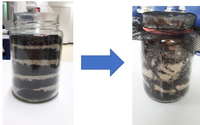
Abbildung 4: Fertiggestelltes Marsterrarium mit einer Schichtung aus Erde und grobem Spielsand (links) und besiedeltes und abgedecktes Marsterrarium (rechts).

Anschließend wird in Anlehnung an das Forschungsprojekt des Experten Wieger Wamelink eine Langzeitbeobachtung vorbereitet (Anleitung: siehe Arbeitsmaterial M1). Die Kriterien einer wissenschaftlichen Überprüfung der Forschungshypothese Wamelinks können aus finanziellen und unterrichtspraktischen Gründen jedoch nicht erreicht werden. Ein erschwingliches, dem hawaiianischen Vulkansand vergleichbares Marsbodenäquivalent konnte leider nicht zur Verfügung gestellt werden. Als umsetzbares Vorgehen eignet es sich, den Fokus auf die Fruchtbarmachung des Bodens durch die Regenwürmer zu legen. Dafür wird ein Regenwurmkriechglas mit abwechselnd Sand- und Erdschicht und oben aufliegenden organischen Abfällen angelegt (siehe Abb. 4). Dies hat den Vorteil, dass die SuS die Grabtätigkeit und die Verwertung von organischen Abfällen beobachten können. Die Glasöffnung wurde mit einem Fliegengitter und einem Gummiring verschlossen, damit die Regenwürmer nicht aus dem Glas kriechen, die Sauerstoffzufuhr jedoch weiterhin gewährleistet war.