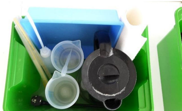
Abbildung 8: Materialbox mit Inhalt für das Experiment Temperaturempfinden. Inhalt der Box: siehe Material 4.