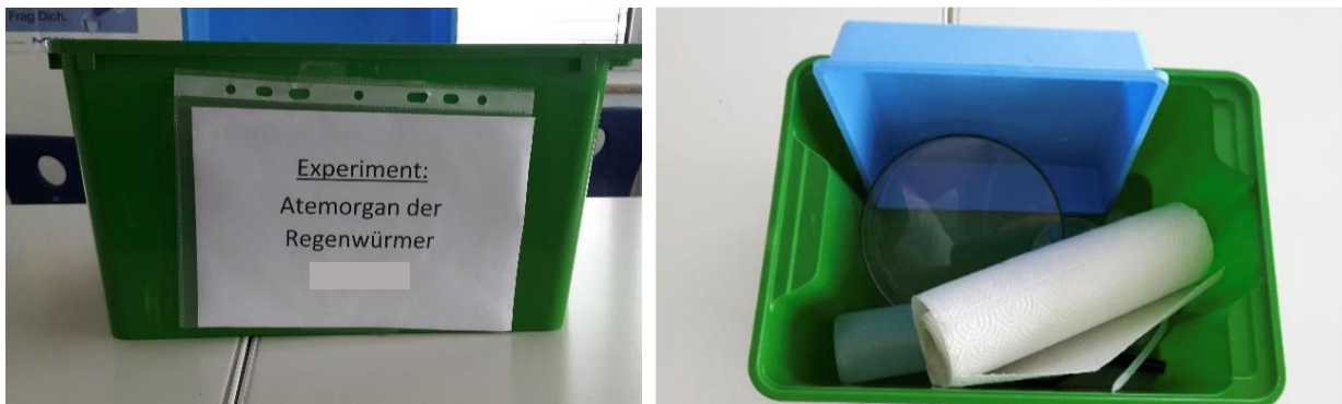
Abbildung 7: Materialbox für das Experiment Atemorgan der Regenwürmer. Box von vorne (links) und von oben (rechts). Inhalt der Box: siehe Material 3.

Um die Lungenatmung auszuschließen werden die Würmer in einem zweiten Versuch für drei Minuten in eine mit frischem Leitungswasser befüllten Plastikwanne gesetzt, währenddessen und danach sind keine Stresssymptome beobachtbar.