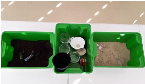
Abbildung 5: Baumaterialien für das Marsterrarium.

einer Schere, einer Rolle Tesafilm, Fliegengitter, einem Einfülltrichter und mit entsprechender Anzahl an Gläsern, Deckeln und Gummiringen. Die Kisten können vorbereitet werden und müssen zu Beginn des Unterrichts nur noch im Raum platziert werden (siehe Abb. 5).