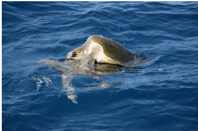
Abbildung 2: Meeresschildkröten bei der Paarung im Wasser an der mexikanischen Pazifikküste

Meeresschildkröten sind im Alter von 15 bis 30 Jahren geschlechtsreif. Die Paarung geschieht im Wasser (Abbildung 2). Üblicherweise suchen Weibchen nach der Paarung ihren Geburtsstrand auf und legen dort ihre Eier ab, dieses Verhalten nennt man Philopatrie. Wie in Abbildung 3 dargestellt, buddelt die Meeresschildkröte nachts eine Grube in den Sand, um dort in einer Nestgrube ihre Eier abzulegen. Diese Nestgrube ist etwa 30 bis 50 cm tief. Dort legt das Weibchen schließlich 80 bis 100 Eier ab. Gewöhnlich passiert dies alle zwei bis drei Jahre. Die Sonne brütet schließlich die Eier aus. Bei Temperaturen von über 29,9°C entwickeln sich Weibchen, bei einer niedrigeren Temperatur Männchen (Wunsch, 2017). Nach ca. sechs bis acht Wochen schlüpfen die Jungtiere und laufen direkt Richtung Meer, wie in Abbildung 4 zu erkennen ist.