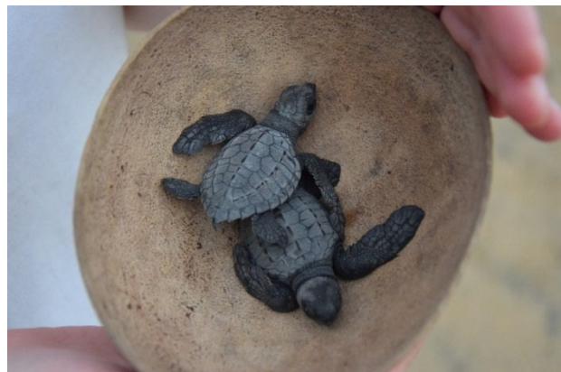
Abbildung 7: Kleine Meeresschildkröten vor der Freilassung durch die Tourist*innen

Weltweit gibt es mittlerweile verbreitet Schutzgebiete für Meeresschildkröten, an denen nicht gefischt oder Boot gefahren werden darf, beziehungsweise wo sich auch keine Menschen aufhalten dürfen. Beispielsweise hat Greenpeace ein Gebiet im Golf von Bengalen mithilfe von Bojen als Schutzgebiete gekennzeichnet. So können die bedrohten olivfarbenen Bastardschildkröten sich dort ungestört paaren und ihre Eier am Strand vergraben. Auch der Weg zum Meer ist so für die Meeresschildkröten zumindest von Seiten des Menschen nicht mehr gefährdet