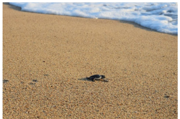
Abbildung 4: Jungtier auf dem Weg in den Pazifik (© Jacob Hein)