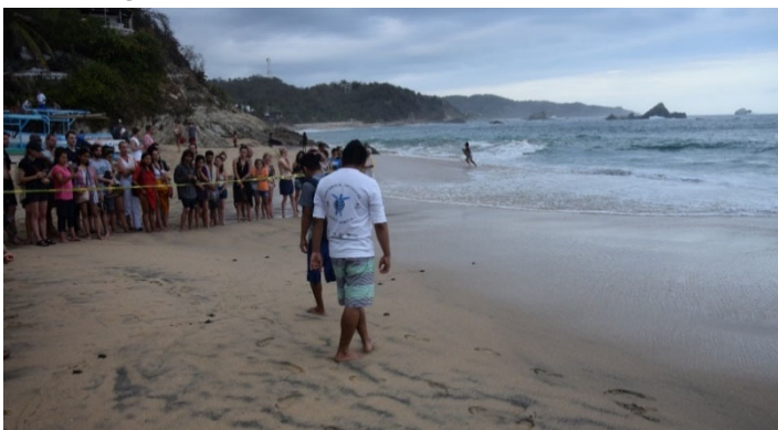
Abbildung 8: Tourist*innen beobachten die Meeresschildkrötenwanderung an der Pazifikküste

(Greenpeace, 2006). Des Weiteren setzen viele Organisationen mittlerweile auf Ökotourismus, Patenschaften und Spendenaktionen, beispielsweise WWF, Greenpeace oder AGA (Aktionsgemeinschaft Artenschutz). Dieser Ökotourismus kann so umgesetzt werden, dass Müll an