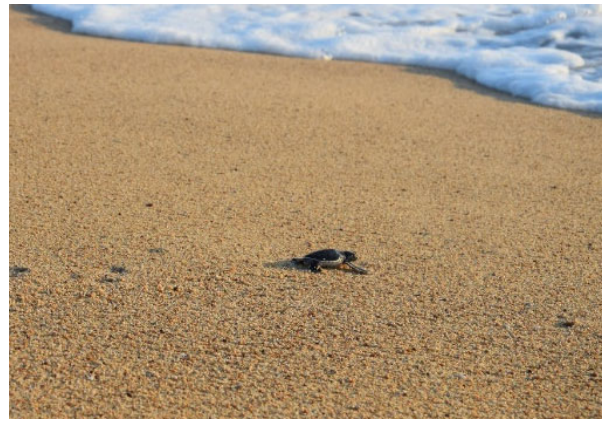
Abbildung 4: Jungtier auf dem Weg in den Pazifik