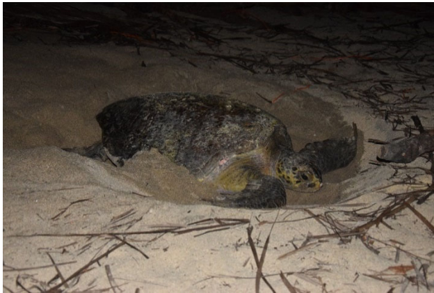
Abbildung 3: Meeresschildkröte in der Nestgrube