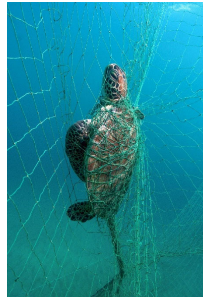
Abbildung 6: Meeresschildkröte gefangen in einem Fischernetz

Die globale Erderwärmung und deren Auswirkung auf die Fortpflanzung der Meeresschildkröten ist ausführlich untersucht. Neue Studien zeigten, dass die Geschlechtsbestimmung der Schildkröten durch die Höhe der Gelegetemperatur bestimmt wird. Bei einem Durchschnitt über 29°C entstehen aus den Embryonen mehr als 50 % Weibchen. Ist die Temperatur kühler, entwickeln sich mehr Männchen. Zunächst hat dies einen positiven Effekt, da durch mehr geschlechtsreife Weibchen mehr Eier gelegt werden und so mehr Nachwuchs entsteht. Dennoch birgt die steigende Temperatur langfristig ein großes Risiko für die Embryonen. Denn wenn die Temperatur weiter bis 33°C steigt, sterben immer mehr Embryonen vorm Schlüpfen (Hempel, 2017).