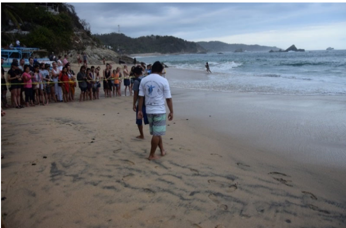
Abbildung 8: Tourist*innen beobachten die

Auch der Weg zum Meer ist so für die Meeresschildkröten zumindest von Seiten des Menschen nicht mehr gefährdet (Greenpeace, 2006). Des Weiteren setzen viele Organisationen mittlerweile auf Ökotourismus, Patenschaften und Spendenaktionen, beispielsweise WWF, Greenpeace oder AGA (Aktionsgemeinschaft Artenschutz). Dieser Ökotourismus kann so umgesetzt werden, dass Müll an den Stränden gesammelt wird oder dass ein gewisser Geldbeitrag gezahlt wird, wenn man bei dem Schlüpfen