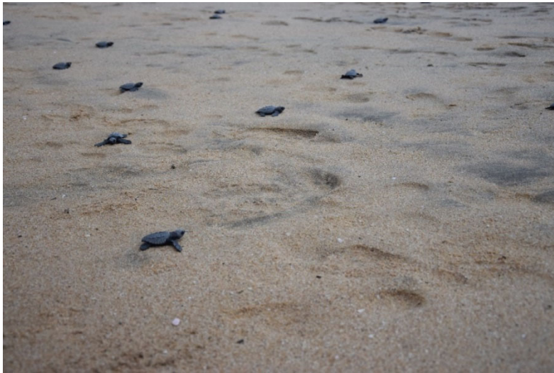
Abbildung 9: Freigelassene kleine Meeresschildkröten auf dem Weg in den Pazifik

Kokosnussschale mit dem Meeresschildkrötennachwuchs. Diese werden dann gemeinsam an einem abgesperrten Strandstück ausgesetzt (Abbildung 8). Wie in Abbildung 9 erkennbar ist, sind die kleinen Meeresschildkröten ungehindert auf dem Weg zum Meer, dies wird dadurch erleichtert, dass es sowohl keinen Müll in diesem abgesperrten Strandstück gibt, als auch keine Folgen durch Tourist*innen am Strand in Form von starken Furchen im Sand oder Hindernisse wie Sonnenschirme oder -liegen.